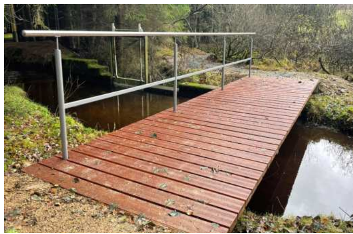
Mostek přes potok Weißbach