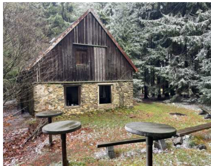
Dochovaný dům osady Bügellohe - otevřené muzeum