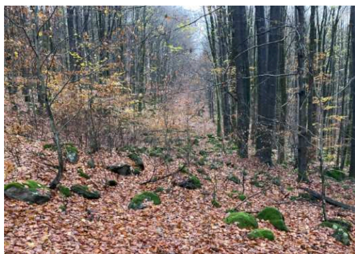
Dodnes zřejmý průsek - vedení železné opony