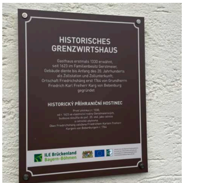
Pamětní deska Grenzwirtschafts Gerstmeier