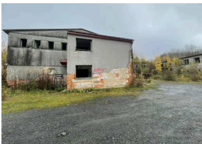
Pozůstatky vojenských objektů

Popisovaná trasa je necelých 15 km dlouhá se zhruba 350 výškovými metry a tvorí okruh . Dá se s určitým nepohodlím absolvovat i na kole. Z pohledu jízdního kola jsou problematické zejména průchod přírodní rezervací Malý zvon a případná návštěva lokality Velká skála. Co je na trase zajímavého? Na vrcholových partiích trasy můžeme navštívit bývalou osadu Václav , kde jsou dodnes ruiny provozu Československé lidové armády a jejich složek radiotechnické rozvědky a pohraniční stráže ( stručná wiki ). Dále pokračujeme doslova ve stopách železné opony a dostaneme se do obtíže prostupného terénu přírodní rezervace Malý zvon . Až se prodereme bučinami a porcelánovými izolátory připomínající smutnou minulost, jsme zpět na sjezdné a snadno průchozí části železné opony. U lokality Velká skála si můžeme "odskočit" na holinu, ze které je nádherný výhled přes celé údolí přes Rybník směrem do bývalých Korytan. Krásně je odsud vidět náš pozemek. Dále si už užíváme prakticky jen samé klesání a u bývalé osady Bernstein si můžeme "odskočit" podívat se na současné bohulibé využití někdejších armádních objektů. Zpět na pozemek zbývají cca 3km.