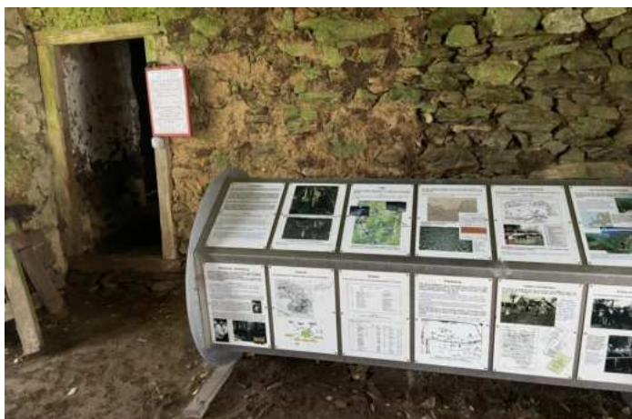
Vnitřek otevřeného muzea