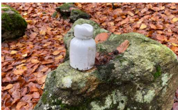
Připomínka smutných časů