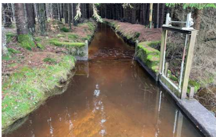
Náhon k mlýnu Wagnermühle