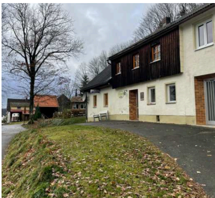
Historická hospoda Grenzwirtschafts Gerstmeier