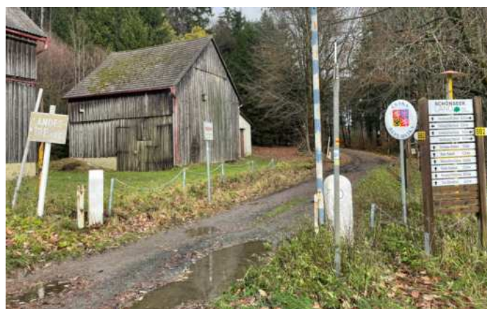
Hraniční přechod Friedrichshäng