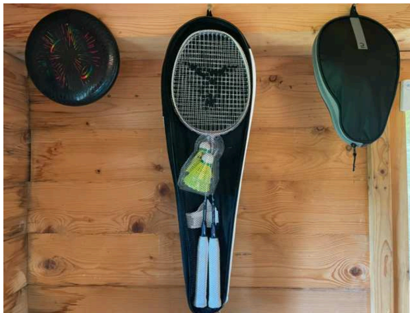
Zleva: frisbee, badmintonové a ping-pongové páčky jsou k dispozici v zahradní chatce na stěně naproti toaletě.

V zahradní chatce na stěně naproti toaletě je k dispozici talíř frisbee.