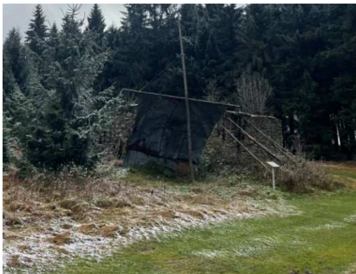
Pozůstatky osady Bügellohe se zbytky plechové střechy v uměleckém aranžmá památníku