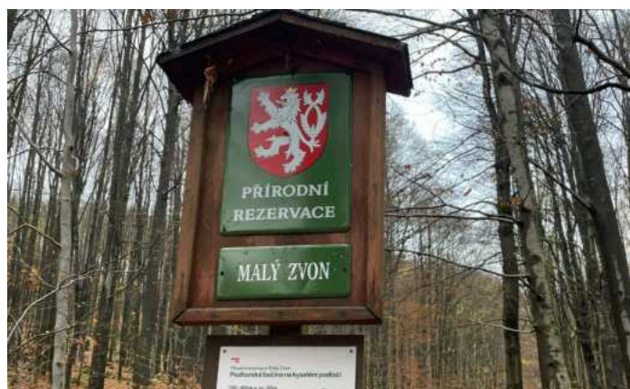
Označení přírodní rezervace