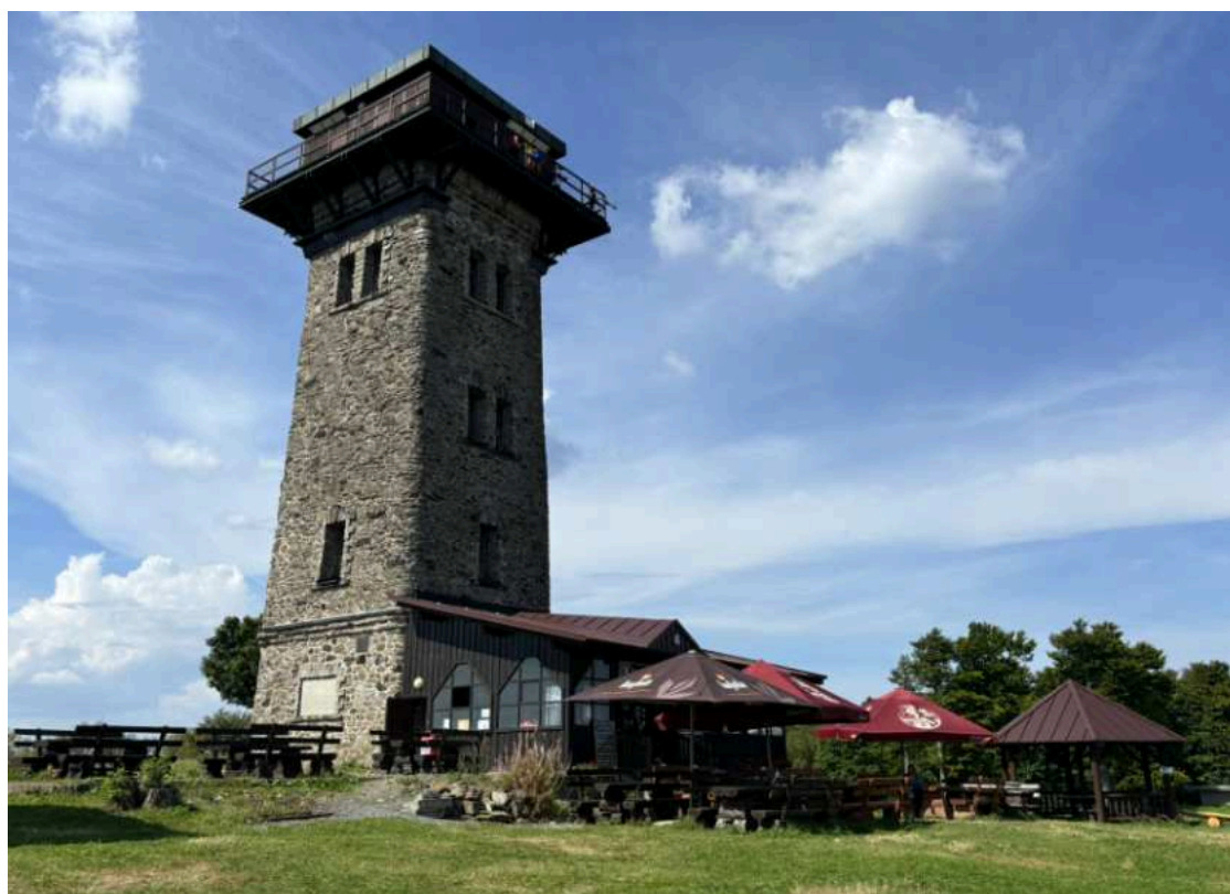
Pohled na Kurzovu rozhlednu na Čerchově