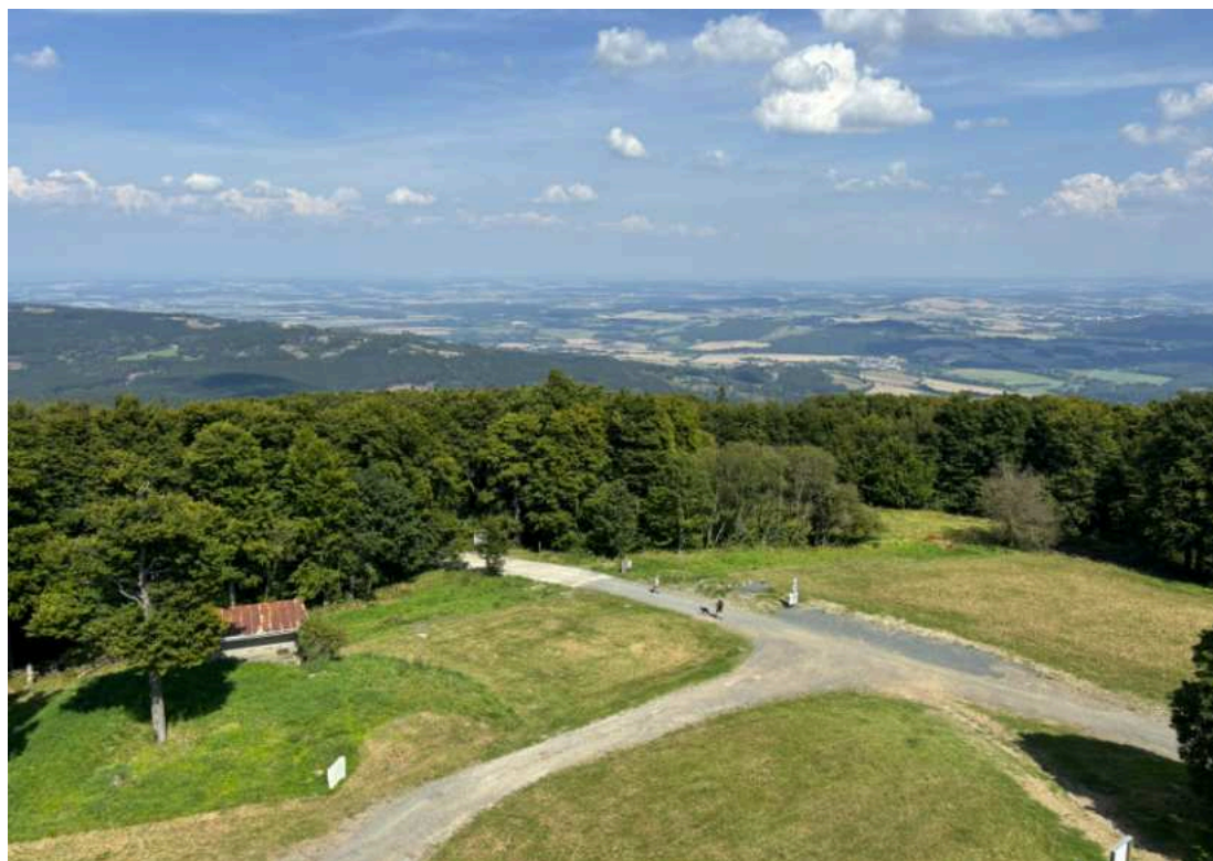
Výhled z Kurzovy rozhledny na Čerchově