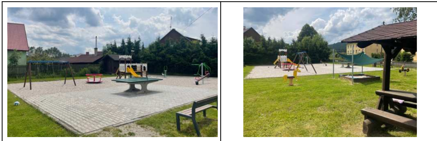
Dětské a volnočasové hřiště v Rybníku

V Rybníku je velmi hezké a dobře vybavené dětské / volnočasové hřiště v tomto místě . Z pozemku sem lze dojít velmi pohodlně a snadno během pár minut.