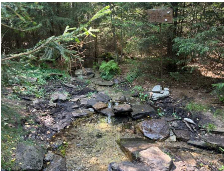
Samotné prameniště Radbuzy