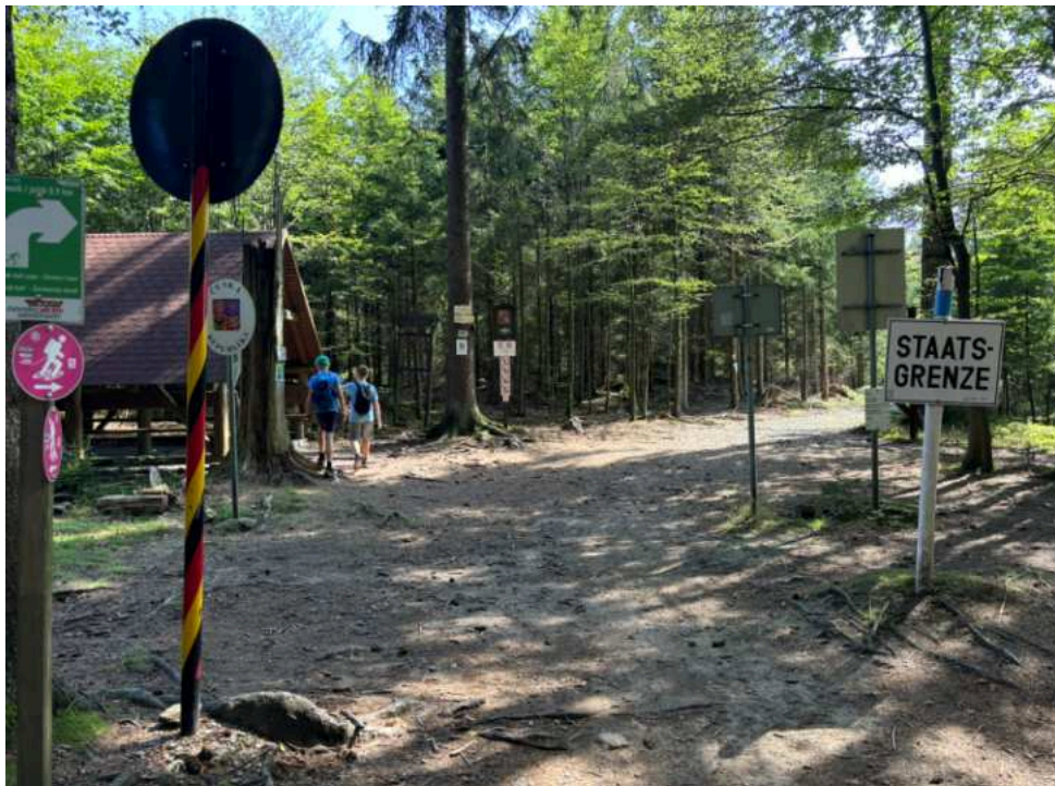
Hraniční přechod při výšlapu na Čerchov z německé strany

Čerchov je se svými 1042 metry nad mořem nejvyšším vrcholem Českého lesa. V létě 2024 jsme s přáteli absolvovali pěkný výšlap s ponecháním automobilu na tomto parkovišti v blízkosti Waldmünchenu. Z pozemku se sem automobilem dostanete za necelou půlhodinu. Na Čerchov jsme prošli tuto trasu . Cesta je velmi pohodlná a zvláště v letních vedrech poskytuje les velmi příjemné prostředí.