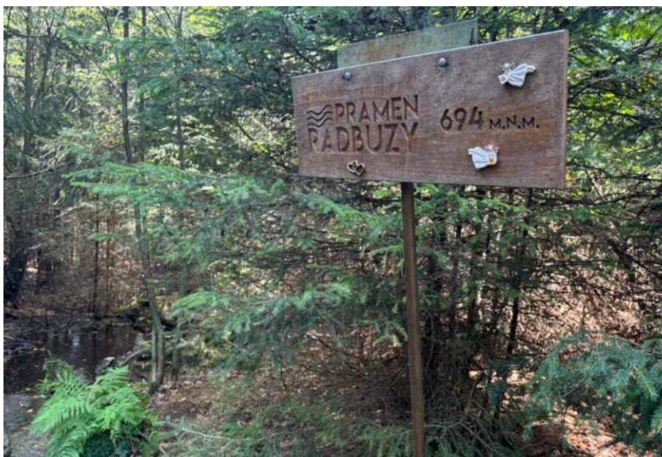
Označení pramene Radbuzy

Nedaleko od Rybníka leží pramen řeky Radbuzy . Trasu lze absolvovat z pozemku; je to 5,5 km daleko se zhruba 200 výškovými metry. Také je možné se přiblížit automobilem na toto parkoviště a dále jít pěšky. V tom případě se pěší túra zkrátí na 1,6 km a zhruba 100 výškových metrů.