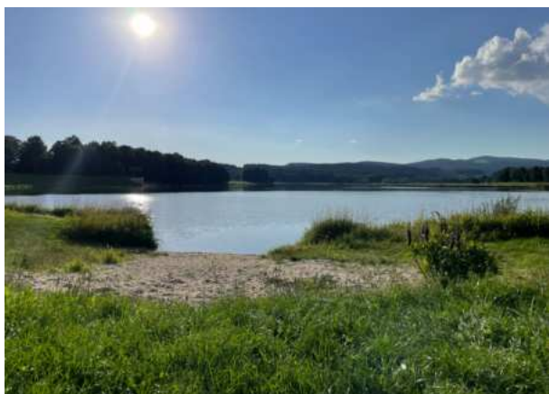
Jedna z pláží biotopu Silbersee - v blízkosti hráze